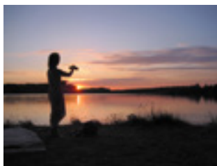
Espaces et terrains sur place et autour du centre Art du Chi Bourgogne.