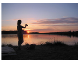
Espaces et terrains sur place et autour du centre Art du Chi Bourgogne.