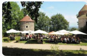
Repas en extérieur par beau temps