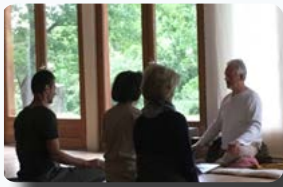
Cours de Tai Chi en extérieur & cours de Chi en salle